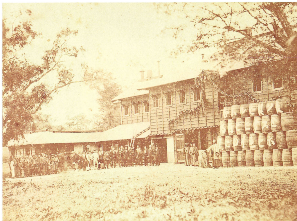
18 武林盛一 札幌麦酒製造所開業式之景 明治9年(1876)9月 鶏卵紙 19.0×25.7 三の丸尚蔵館