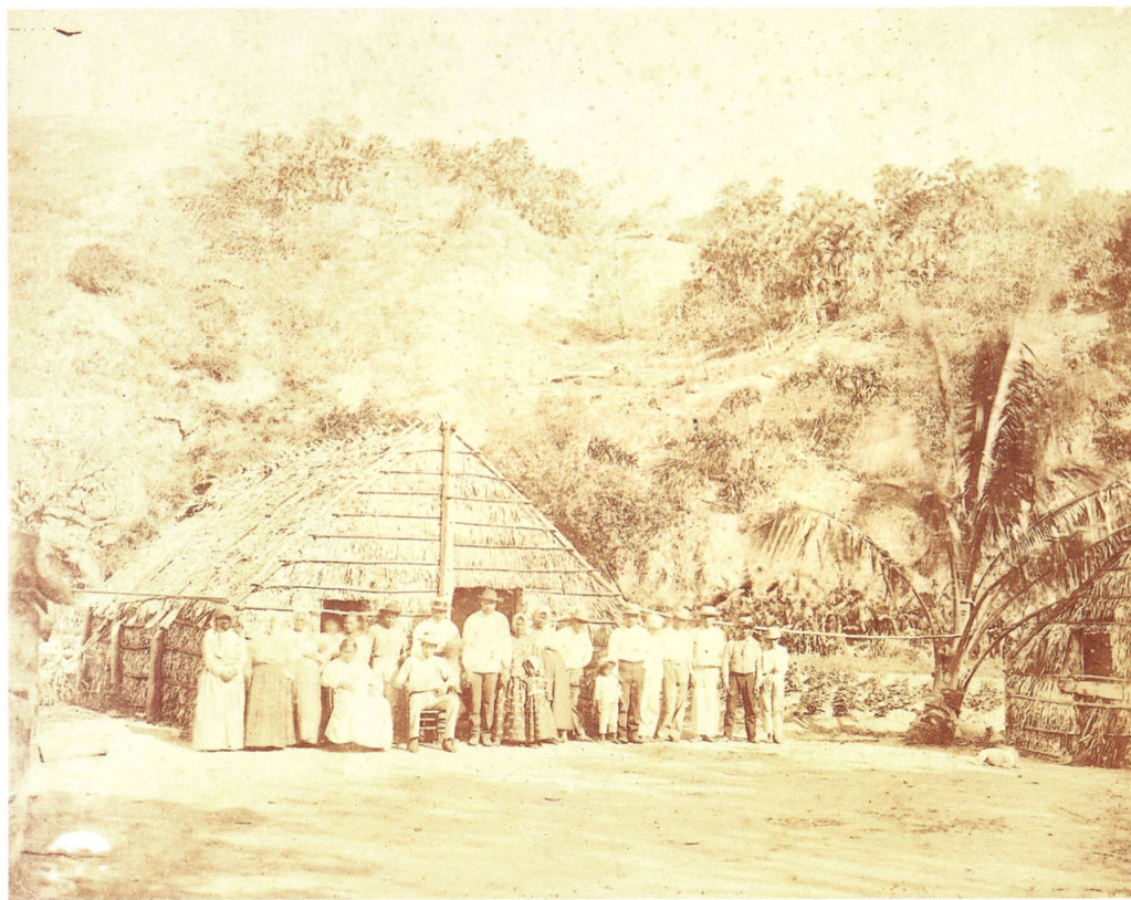
17 松崎晋二 小笠原島父島ノ内大村 セームスチユクラーブ居宅 明治8年(1875) 鶏卵紙 21.0×26.5 三の丸尚蔵館