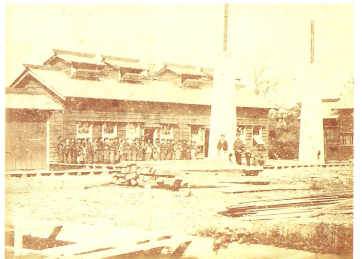
22 武林盛一? 札幌紡織場製糸器械室 明治10年代 鶏卵紙 19.0×25.4 三の丸尚蔵館