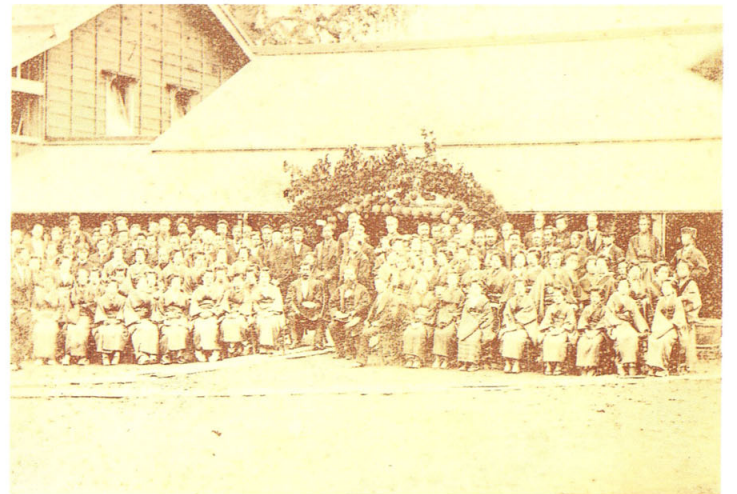
20 武林盛一? 札幌製糸場開業式之景 明治9年(1876)9月 鶏卵紙 16.7×24.3 三の丸尚蔵館